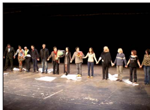
« La première fois, on m'a dit... Faces à faces », Théâtre du Soleil

La soirée du samedi 10 novembre a été l'occasion de la clôture officielle du projet FAAR. C'est cinq années de travail auprès des demandeurs d'asile et des réfugiés à Paris qui ont été fêtés le 10 novembre, en présence de 400 personnes, dont de nombreux participants de ces deux projets, les organismes partenaires et des amis et collègues de la Cimade.