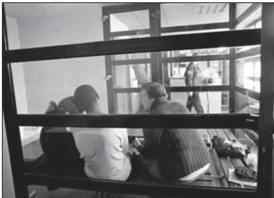
David Delaporte / Cimade

L'histoire de la rétention, c'est donc l'histoire de la pérennisation des CRA, mais aussi celle de leur contrôle et de la spécialisation de leur gestion – et c'est donc aussi l'histoire des « résistances officielles » de la Cimade au cœur de l'État, avec lui et contre lui. Depuis le scandale de la « prison clandestine » d'Arcenc entre 1975 et 1980 jusqu'aux mobilisations plus récentes, le mouvement est sans cesse relancé : officialisés, les centres sont aussi plus visibles, offrant d'autant plus prise à l'expertise et à la contestation associative, comme aux actions devant les tribunaux. L'observation du travail des intervenants sur le terrain vient compléter cette analyse : elle permet de voir le travail critique en train de se faire. Dès lors qu'ils incluent une équipe Cimade, la vie des centres de rétention est faite d'une multitude de tensions, de micro-affrontements et de « rappels à la norme » plus ou moins fréquents et plus ou moins suivis d'effets, au gré des rapports de forces locaux entre acteurs associatifs et services de garde