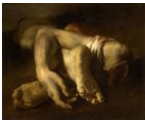
Théodore Géricault, Etude de pieds et de mains