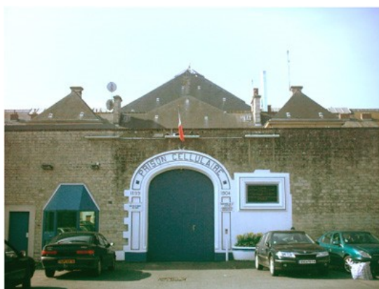
Maison d'arrêt de Caen

Au total, huit recours avaient été déposés en mars, en référé et sur le fond, a indiqué jeudi à l'AFP Me Jacques Martial, président de l'Association pour les défense des droits et de la dignité des détenus et de leur familles. Deux autres ordonnances sont attendues dans les jours qui viennent. D'autres recours sont en préparation, a-t-il ajouté.